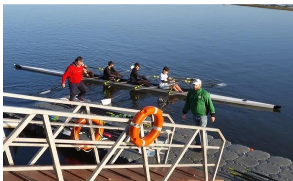
Plataforma flutuante existente e a substituir