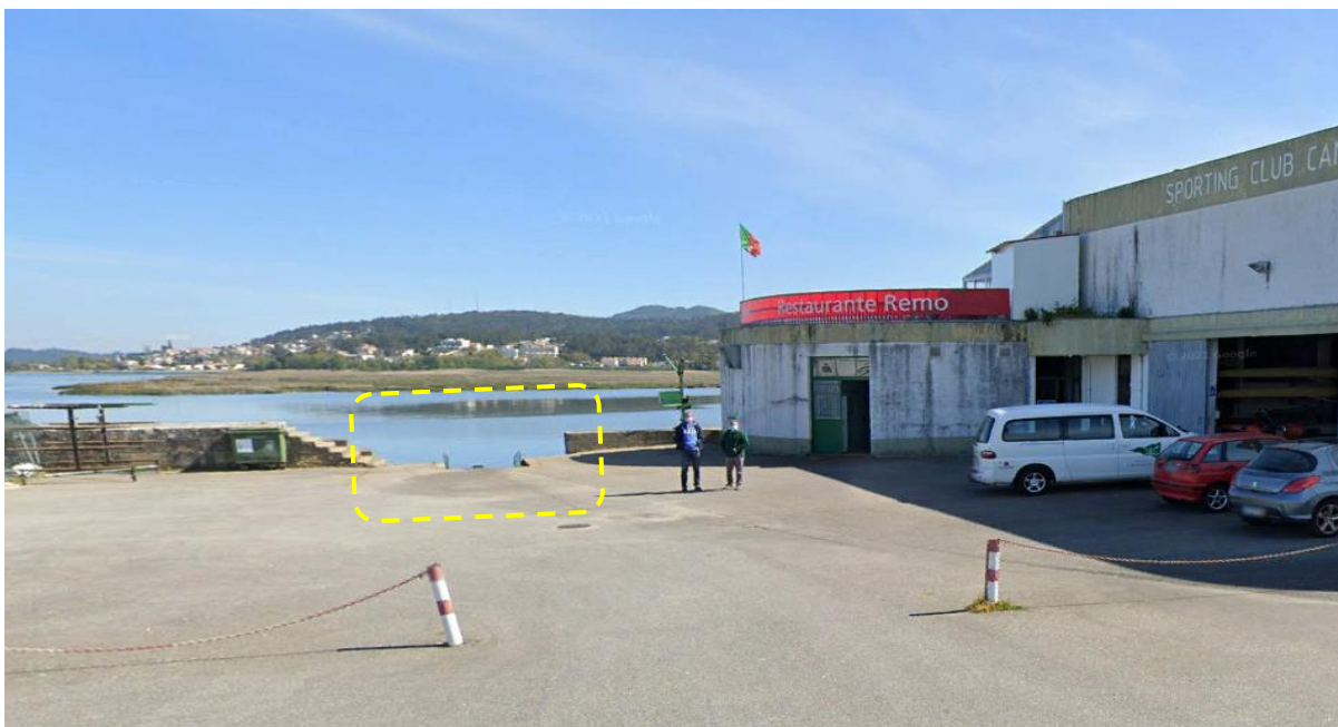
Localização da plataforma flutuante